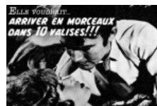
THÉÂTRE AUX ÉCURIES - SAISON 2012-2013 Elle voudrait... arriver en morceaux dans dix valises

À gagner, une paire de billets par semaine pour un spectacle du Trident.