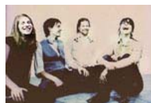
Esmerine : Au Cercle