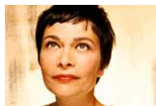
Sandrine Piau : Au Palais Montcalm